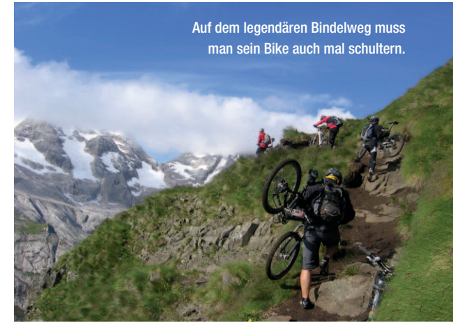
Auf dem legendären Bindelweg muss man sein Bike auch mal schultern.

Heute sollten wir möglichst früh starten, um die erste Gondel auf die Porta Vescovo (2476 m) zu erwischen. Die Seilbahn hat von Mitte Juli bis Mitte September geöffnet und die erste Gondel fährt morgens um halb neun. Wenn wir es schaffen, zeitig oben zu sein, liegt der legendäre Bindelweg noch einsam vor uns. Ab 10 Uhr sind hier in der Regel bereits sehr viele Wanderer unterwegs und man muss häufig absteigen und schieben. Daher gilt: Nur der frühe Biker genießt den Trail! Dieser schlängelt sich direkt gegenüber der Marmolada oberhalb des tiefblauen Fedaiasees zum Pordoijoch